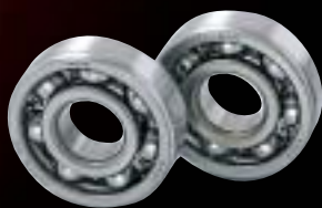
FA Deep Groove Ball Bearings FA深溝玉軸受