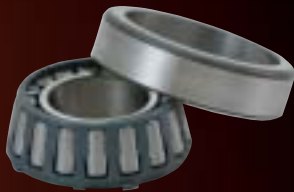
Super-High Capacity Tapered Roller Bearings 超高負荷容量円すいころ軸受