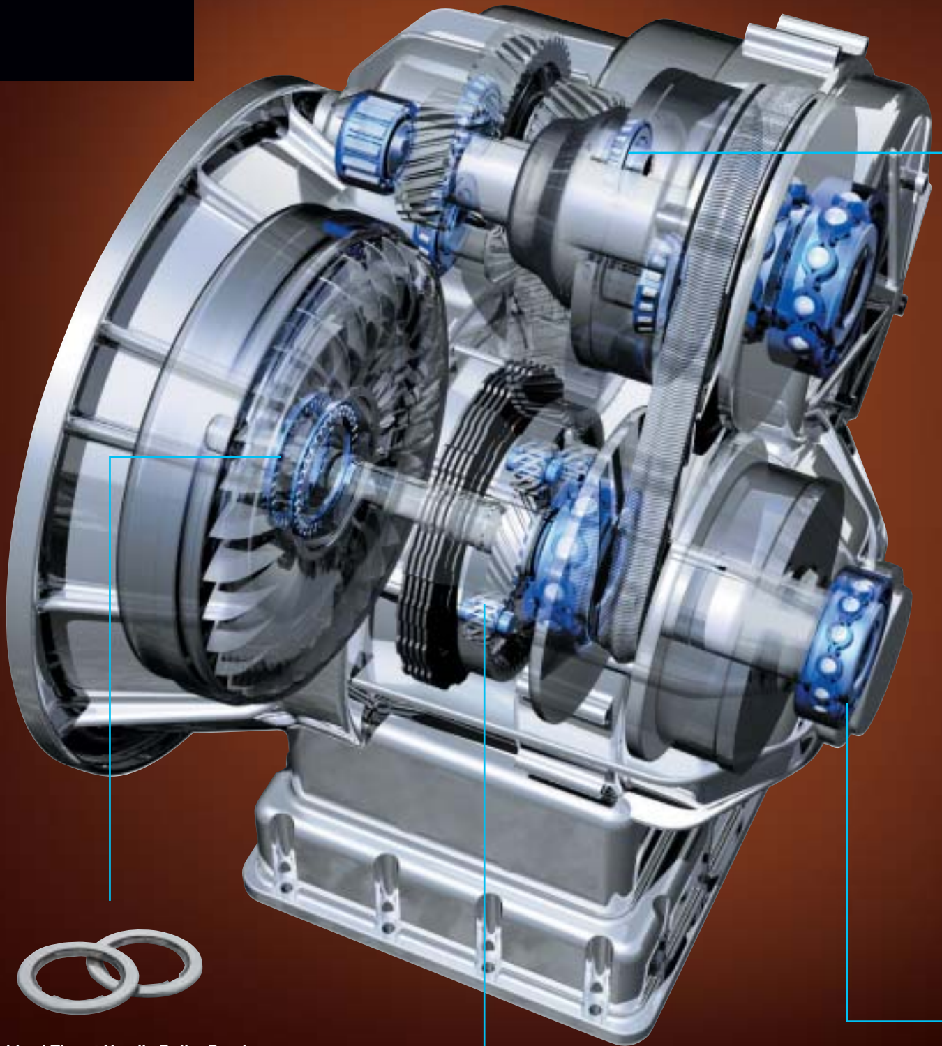
Unitized Thrust Needle Roller Bearings for Eccentric Applications トルコン用偏心対応レース一体型 スラストニードルローラベアリング